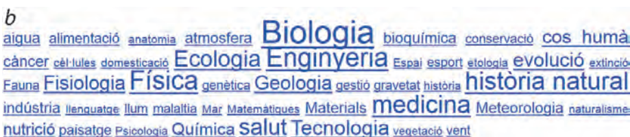
Figura 1. Classificació temàtica dels gairebé tres-cents capítols de Quèquicom emesos. L'ordenació és alfabètica (a). Paraules clau més usades per etiquetar un terç dels capítols emesos, la mida relativa correspon a la freqüència d'ús (b).