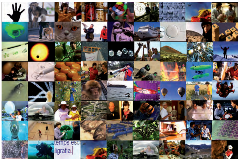
↑ Figura 2. La televisió és una finestra audiovisual al món. Quèquicom ha introduït la ciència en aquest món d'una manera transversal i original. Si una imatge val més que mil paraules, setanta-dues imatges són el resum d'una dècada.

Els espais naturals són una altra categoria prou ben representada, ja que és agraïda visualment, i ofereix al públic la possibilitat de viatjar virtualment. En darrer lloc trobem les categories «os», aquelles que són poc visuals, no tenen protagonista i són científicament més abstractes, com les matemàtiques, la lingüística, la política o la filosofia de la ciència (les dues darreres agrupades en la categoria altres ). Hi hem dedicat pocs capítols i ens han obligat a esmerçar-hi un gran esforç, malauradament no sempre valorat per l'audiència.